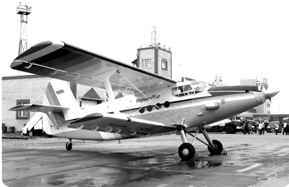
Самолет ТВС-2МС готовится к первому полёту

На начальном этапе эксплуатации самолёты будут обеспечивать маршруты Нарьян-Мар – Усинск – Нарьян-Мар, Харута – Инта – Харута и Нарьян-Мар – Хорей-Вер – Нарьян-Мар. Далее планируется запускать судна на остальные маршруты внутри региона, рассматри-