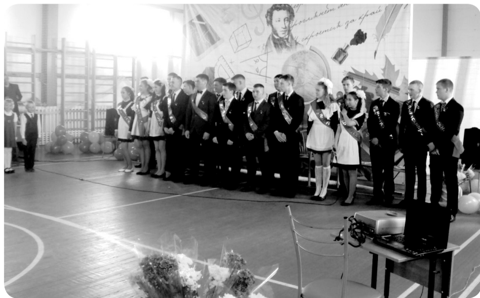
Выпускники школы села Нижняя Пёша

В очередной раз средняя школа Нижней Пёши отпустила выпускников в самостоятельную жизнь. Педагоги и наставники надеются, что ребята будут успешны и смогут реализовать себя.